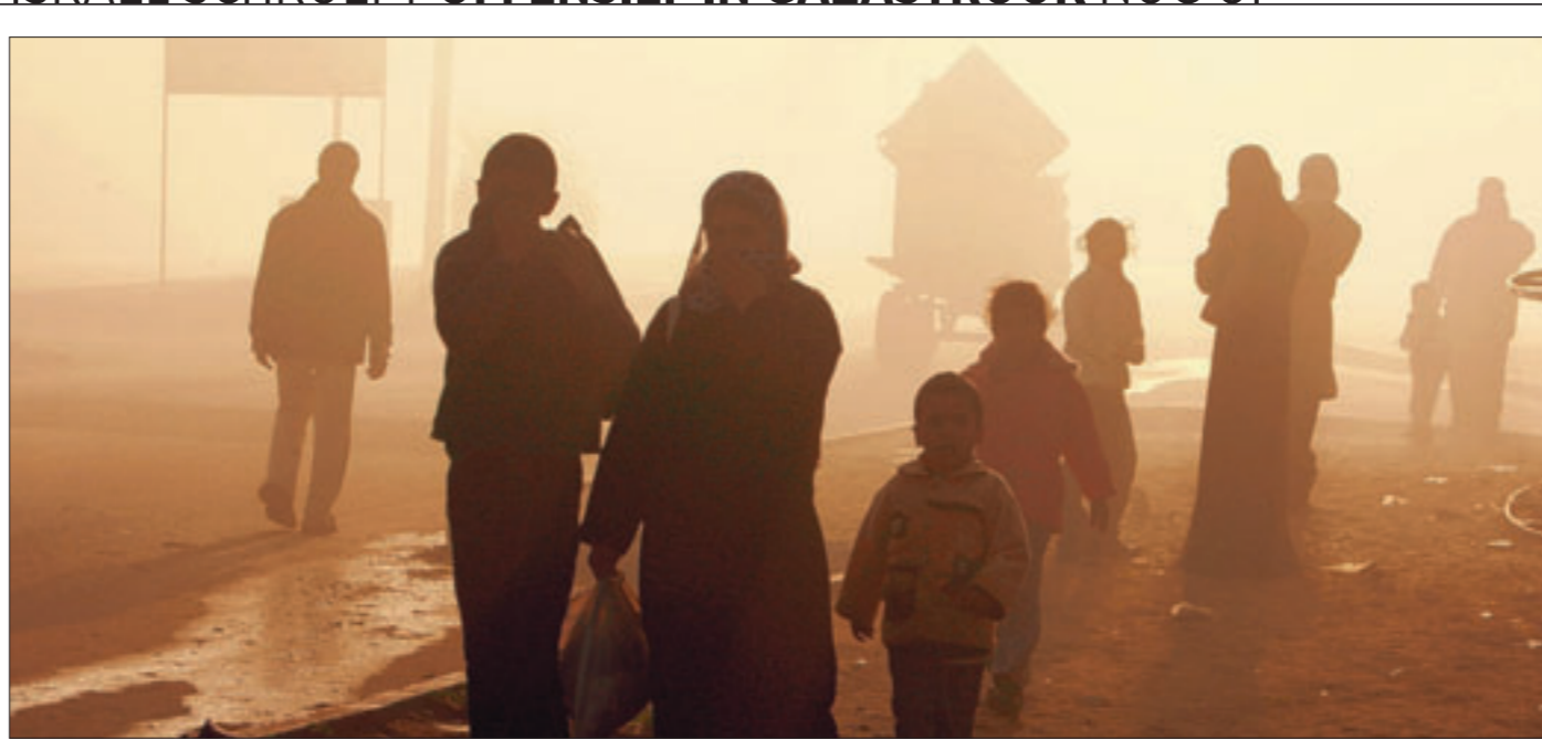
Palestijnen sloegen gisteren op de vlucht voor zware gevechten in de Gazastrook. Israëliëse troepen trokken er geleidelijk de dichtbevolkte woonwijken en vluchtelingenkampen binnen, op zoek naar militanten van Hamas. Die reageerden met raketaanvallen op het zuiden van Israël. Volgens Palestijnse dokters kostte de oorlog sinds 27 december al het leven aan meer dan 900 Palestijnen, onder wie ruim 250 kinderen. ■ Pagina 12